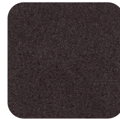
Dark Brown 04