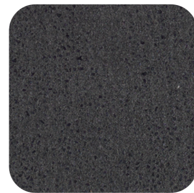
Dark Grey 09