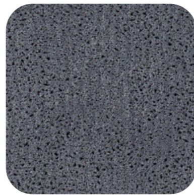
Ice Lake 16