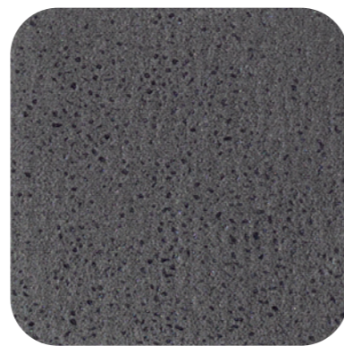
Grey Stone 17