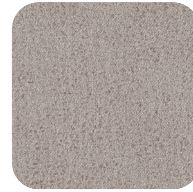
Light Grey 01